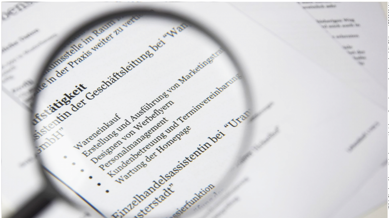
Für manche Personalier sind viele Jobstationen nach wie vor ein Indiz für Unzuverlässigkeit.